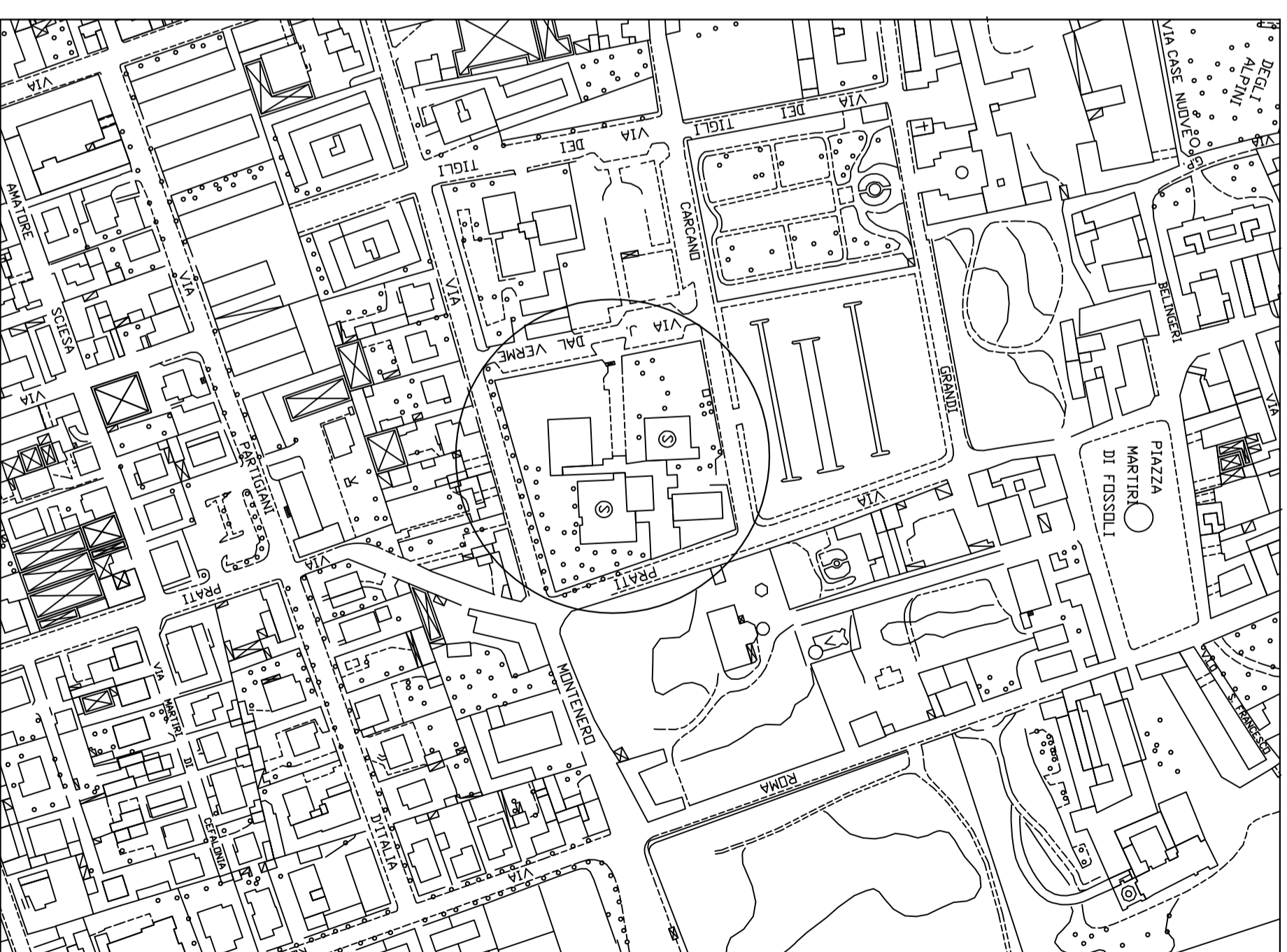
INDIVIDUAZIONE AREA OGGETTO D'INTERVENTO AEROFOTOGRAFOMETRICO SCALA 1:1000